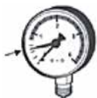
Manometerinställning före vattenpåfyllning