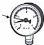
Manometerinställning vid max arbetstryck